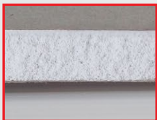
▲ แผ่นยิปซัมตราช้างพลาสติก