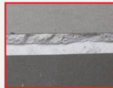
▲ แผ่นยิปซัมทั่วไป