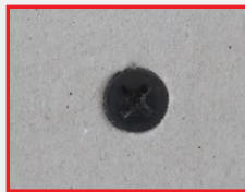
▲ แผ่นยิปซัมตราช้างพลาสติก