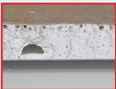
▲ แผ่นยิปซัมทั่วไป

รอยตัดและหักแผ่นเรียบ ลดเวลาขัดแต่ง และลดปริมาณฝุ่น