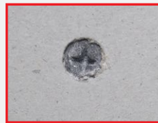
▲ แผ่นยิปซัมทั่วไป